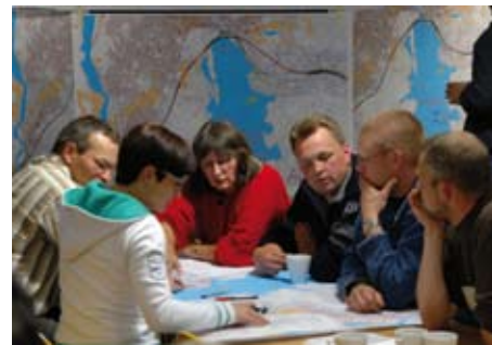
Illustrasjon 3. Møtedeltakerne inviteres til å skrive og tegne løsninger på kart.

Kommunen har et internt dialogforum, hvor ordfører, varaordfører, rådmann og 8 gruppeledere fra partiene i kommunestyret møtes. Møtet har en uformell status. Arbeidsgruppen fra interesseorganisasjonene er invitert til flere møter i forumet for å redegjøre for sine standpunkter. Det er vanskelig å komme nærmere den samlede politiske makt i en kommune uten å være politiker. Politikernes uttalte hensikt med å invitere organisasjonene inn, er å forsøke å samle politiske, administrative og interesse-